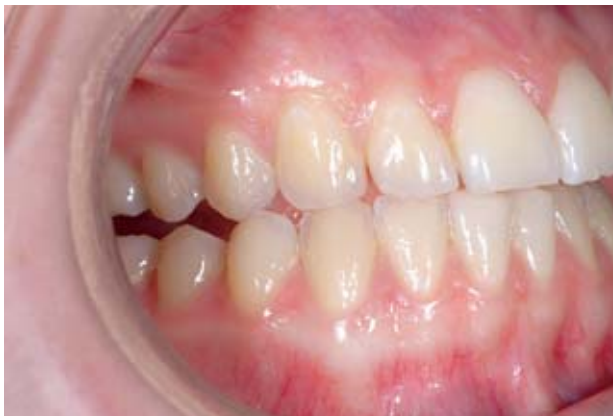
Abbildung 1 Zahnhalsempfindlichkeit aufgrund von mesial exzentrischen Parafunktionen mit z. T. erheblichen Schmelzverlusten an 13 und 12 bei gleichzeitigem Verlust rechtslateraler Führungsmuster.