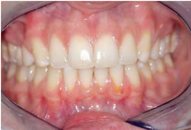
Abbildung 5 Die Behandlung des mukogingivalen Problems muss im therapeutischen Mittelpunkt stehen, nicht der empfindliche Zahnhals.