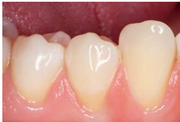
Abbildung 8 Freiliegende hypersensible Zahnhälse im 4. Quadranten. Die Patientin äußert Beschwerden bei der täglichen Mundhygiene und dem Genuss gekühlter Nahrungsmittel.

rigem pH-Wert (wie Rotwein), andererseits aber auch das wiederholte Trinken saurer Säfte ohne entsprechende Remineralisationsphasen. Im Zentrum therapeutischer Maßnahmen steht hier eine Modifikation des Trinkverhaltens. Das ist bei Obst-säften möglich, bei Rotwein weniger – man kann ja kaum die ganze Flasche auf einmal austrinken. Der schmerzempfindliche Zahnhals lässt sich in diesen Fällen allein durch häusliche Maßnahmen therapieren. Neuartige Zahnpasten lindern in kürzester Zeit die Beschwerden. Da sich erfahrungsgemäß das Trinkverhalten über die Zeit nicht verändern lässt, ist hier die wiederholte häusliche Anwendung desensibilisierender Zahnpasten eine conditio sine qua non (Abb. 4).