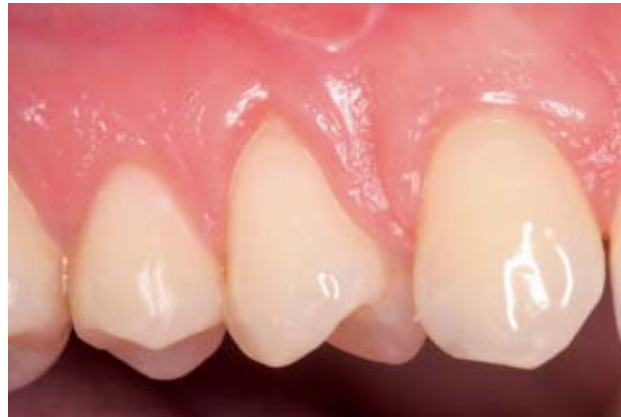
Abbildung 6 Freiliegender hypersensibler Zahnhals an 14. Die Patientin äußert sehr unangenehme Schmerzen, die im Rahmen der täglichen Mundhygiene auftreten. Die Verwendung desensibilisierender Zahnpasten brachte bisher kaum Linderung.