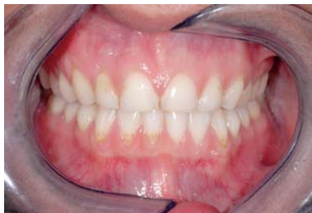
Abbildung 4 Nach Abstellen des ungünstigen Trinkverhaltens (Ursache) ist es meist ausreichend, den empfindlichen Zahnhsal allein durch häusliche Maßnahmen zu therapieren.

eine Fehlbelastung. Diese kann sowohl auf der Arbeitsseite, aber auch auf der Balanceseite auftreten.