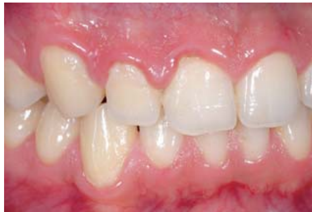
Abbildung 2 Nach Etablierung adäquater Plaquezustände reichen Fluoridspülungen, fluoridhaltige Lacke oder auch hochdosierte fluoridhaltige Zahnpasten (z.B. Duraphat Zahnpaste) zur Behandlung des empfindlichen Zahnhalses durchaus aus.