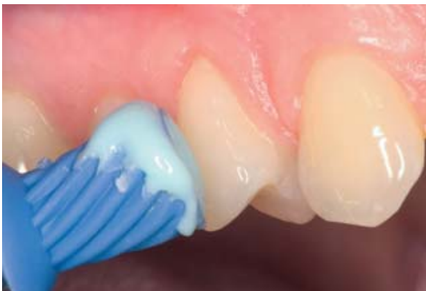
Abbildung 7 Die Desensibilisierungspaste wird insgesamt 2 x 3 Sekunden mit einem Gummikelch auf die betroffene Oberfläche appliziert. Nach der Behandlung verschwanden die Schmerzen.