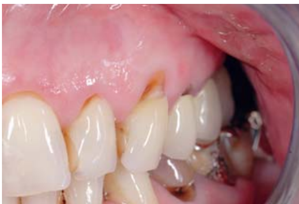
Abbildung 3 Große empfindliche keilförmige Defekte, entstanden durch nicht adäquate Mundhygienetechniken, lassen sich am besten durch adhäsive Füllungen behandeln.