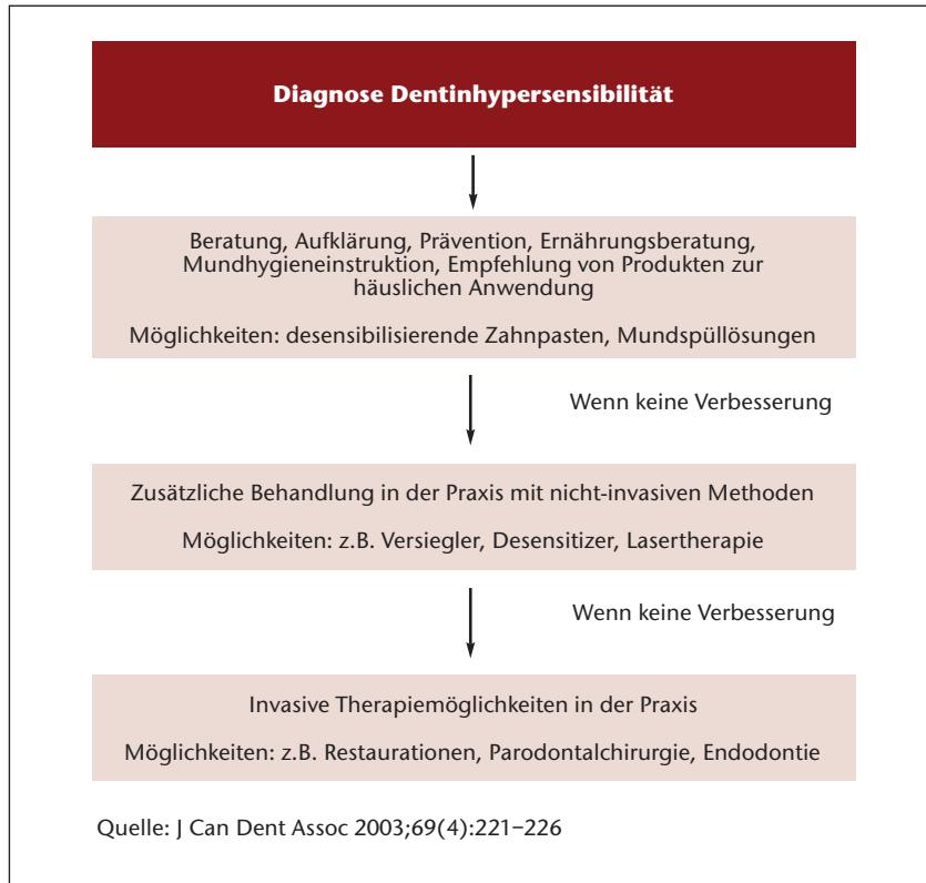
Grafik 1 Therapieschema.

Laurisch: Horizontales Schrubben, zu viel Druck, harte Zahnbürsten und abrasive Zahncremes haben nicht nur Abrasionen zur Folge, sondern häufig auch parodontale Rezessionen mit freiliegenden Wurzeloberflächen. Dies führt letztlich zu