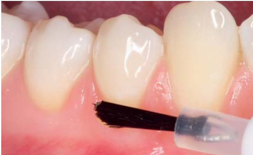
Abbildung 9 Die Applikation erfolgt mit einem Pinsel. Im Anschluss an die Behandlung beschreibt die Patientin eine deutliche Besserung der Symptomatik.