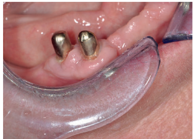
Abbildung 2 Hyperplastische Veränderung durch blutdrucksenkende Mittel.