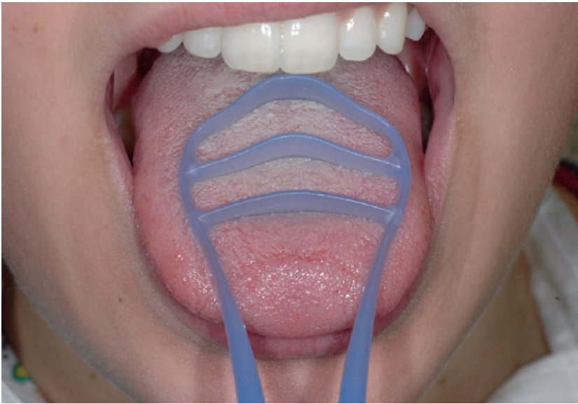
Abbildung 6 Häusliche Zungenreinigung. Figure 6 Domestic tongue cleaning.

chelrestmengen gebildet werden, bzw. dass die Speicheldrüsen ihre Fähigkeit zur Sekretion noch bewahrt haben,