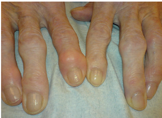
Abbildung 1 Arthrotische Hände.