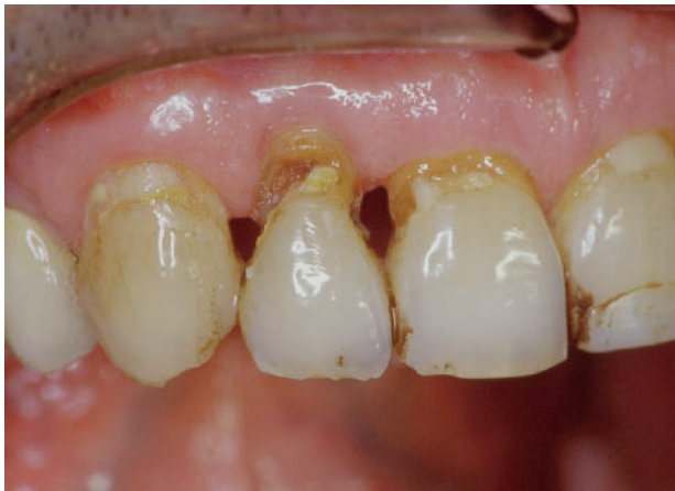
Abbildung 4 Wurzelkaries bei reduziertem Speichelfluss. Figure 4 Root caries in reduced salivary flow conditions.