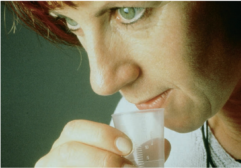
Abbildung 3 Bestimmung der Sekretionsrate. Figure 3 Determination of the salivary flow rate.

und Rachenraum nach. Schmerzen beim Kauen wiederum verändern Kaufunktion und Art der Nahrungsaufnahme. Weiche kauenaktive Kost wird bevorzugt, diese wiederum klebt aufgrund des fehlenden Speichels länger an den Zähnen, was zu der bekannten kaum beherrschbaren Kariesentwicklung in diesen Fällen führt. Hier fehlt also der Speichel sowohl als Gleitspeichel als auch als remineralisierendes Medium.