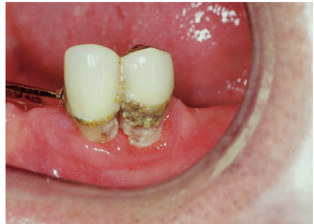
Abbildung 5 Wurzelkaries und parodontale Hygieneprobleme bei reduziertem Speichelfluss.